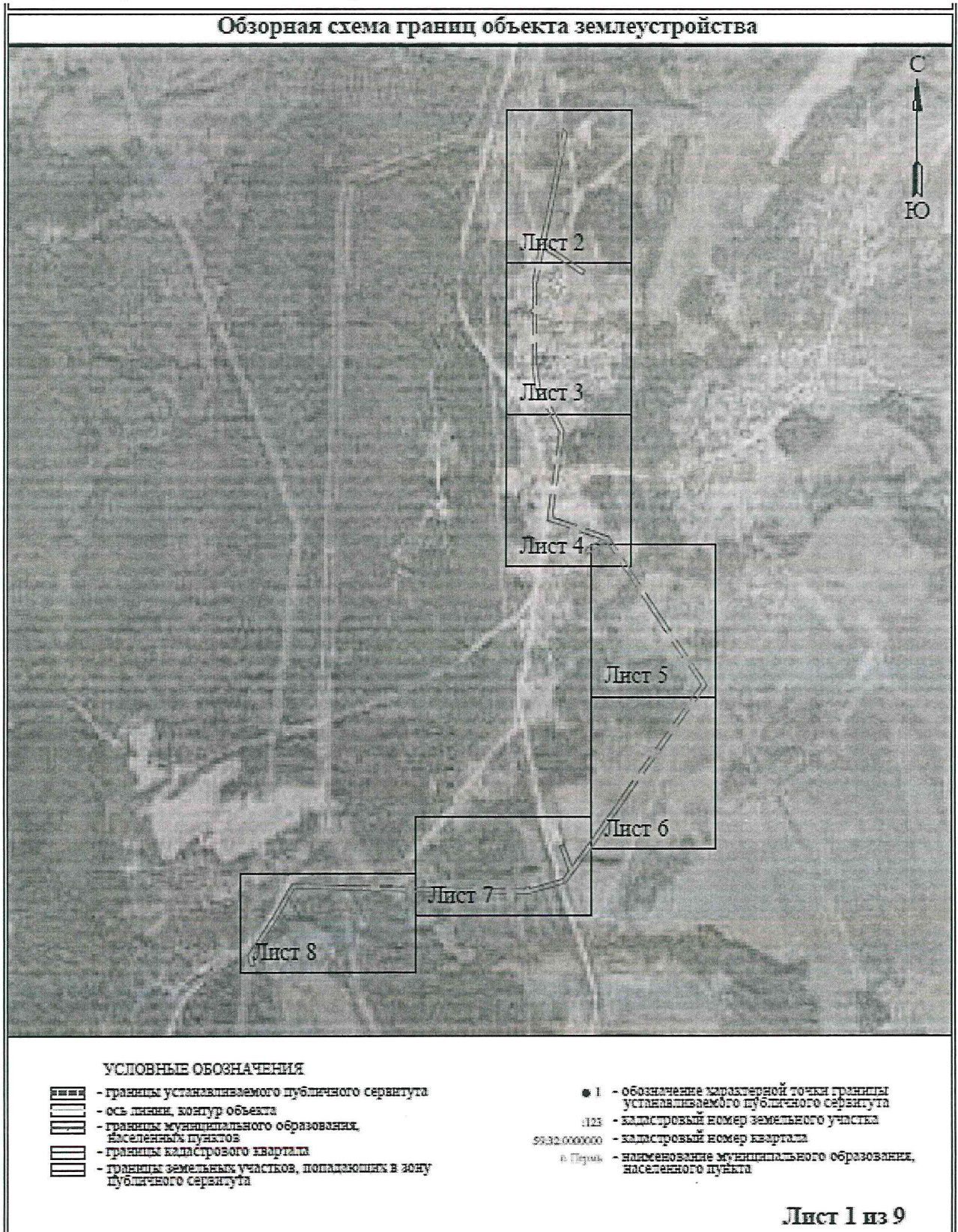
СХЕМА РАСПОЛОЖЕНИЯ ГРАНИЦ ПУБЛИЧНОГО СЕРВИТУТА Эксплуатации объекта электросетевого хозяйства ВЛ-10 кВ н.п. Рождественское